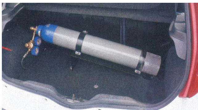
Rys. 1. Wysokociśnieniowa butla przeznaczona do transportu podtlenku azotu w bagażniku samochodu Fiat Punto [5]

Upper curves represent nitrous oxide supply [5].